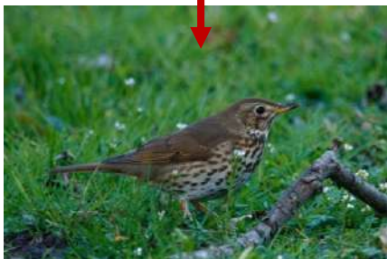
Grive draine (légèrement plus grise que la Grive musicienne)