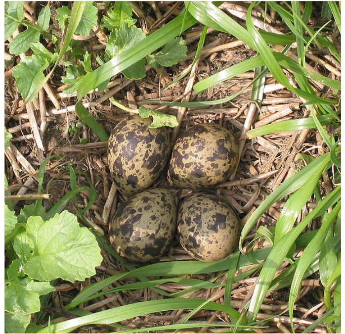
Nid avec ses œufs