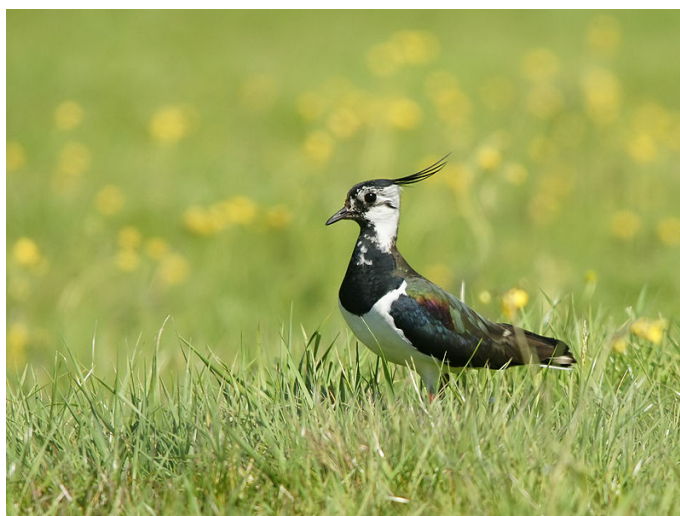
Vanneau huppé adulte

Par contre, les effectifs hivernants sont en déclin à cause de l'intensification des pratiques agricoles et de la dégradation des milieux naturels comme les zones humides.