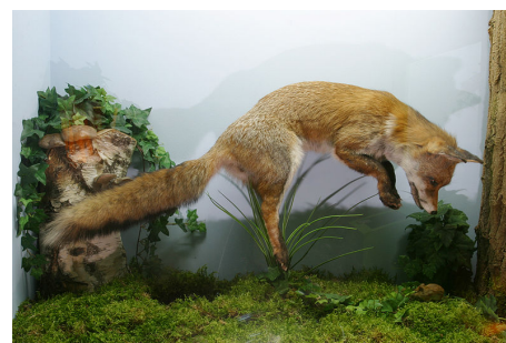
Renard en train de muloter