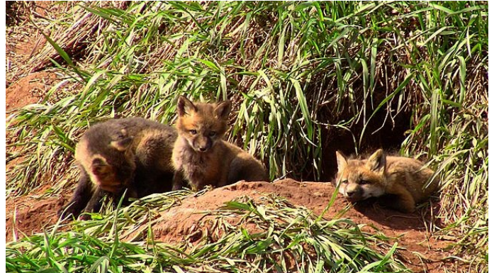
Renardeaux devant l'entrée du terrier